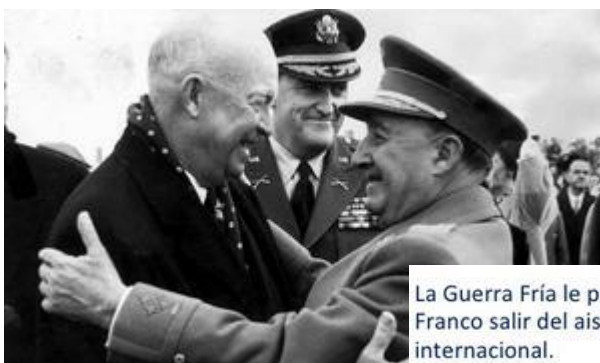
La Guerra Fría le permite a Franco salir del aislamiento internacional.

Asamblea General de la ONU, 12 de diciembre de 1946.